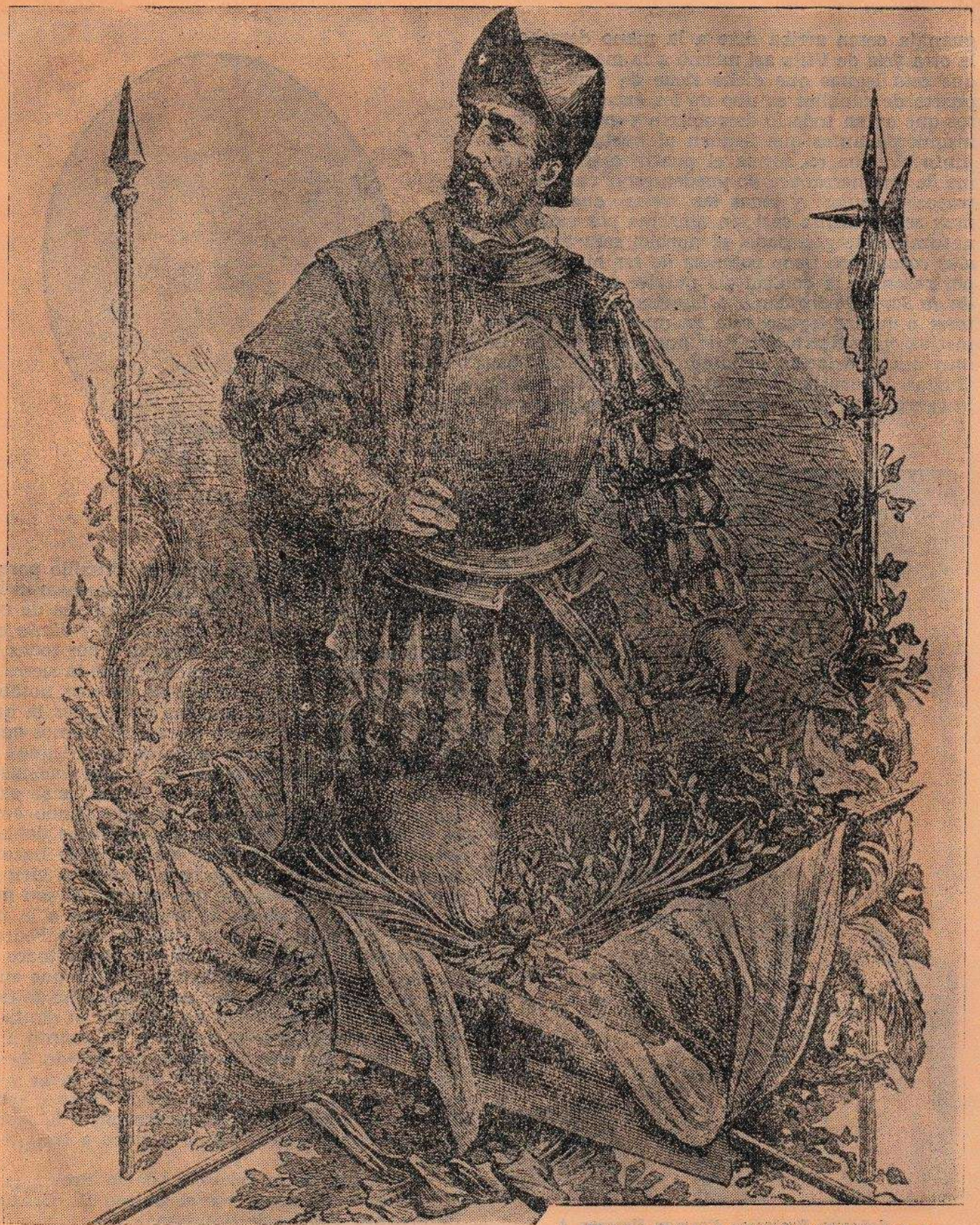
DON PEDRO DE ALVARADO